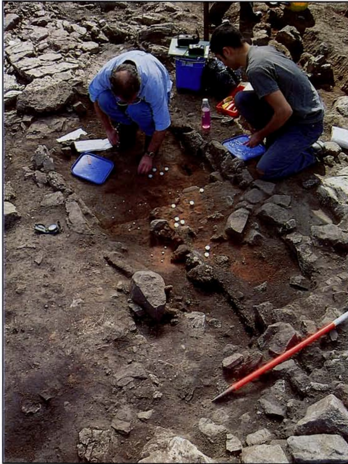
Cloddio yn adeilad 1 ym 1997. Excavation in progress on building 1 in 1997.

An area of stone paving to the west of building 1 marked the position of the entrance to a third sunken-floored building. Ploughing appears to have removed any clear evidence for the walls of what was probably a slightly smaller rectangular building. Finds within black earth covering the sunken floor included a fine bronze buckle of 10th-century type and an iron knife blade with