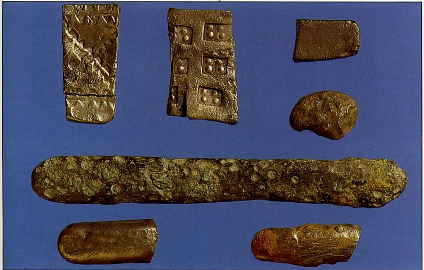
Drylliau o ingotiau arian a breichdorchau o fath Gwyddelig-Nordig o'r 10ed ganrif Fragments of silver ingots and arm-rings of 10th-century Hiberno-Viking type

silver in Wales is coastal in character. The site of St Deiniol's monastery at Bangor has produced two hoards, one deposited about 925, and a small group of coins deposited c. 970. The later Bryn Maelgwyn hoard of coins near Llandudno was deposited in the mid-1020s, and may be Viking booty rather than local savings. A remarkable hoard of five complete Viking silver arm rings of