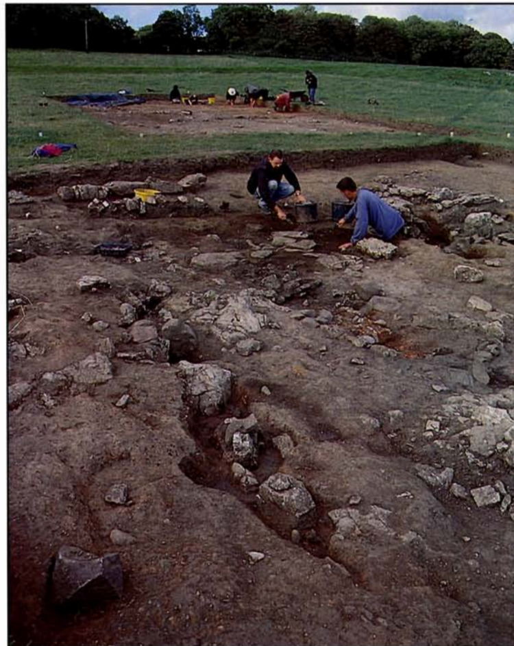
Cymryd samplau o'r aelwyd yn adeilad 1 at ddiben dyddio archeomagnetig The hearth in building 1 being sampled for archaeomagnetic dating

For an unbiased contemporary picture of Viking Wales, we have to turn to archaeology. The distribution of known hoards of Viking